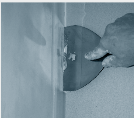
5. Montaži plošč sledi fugiranje.