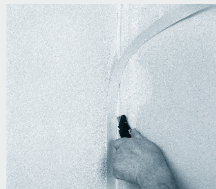
6. Po osušitvi odrežemo odvečne trakove.