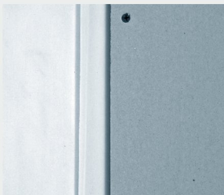
4. Knaufove plošče montiramo z razmakom 5 mm.