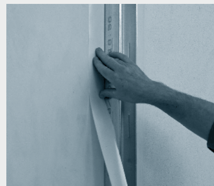
3. Alternativno ločilni trak nalepimo na gradbeni element, ki se stika.