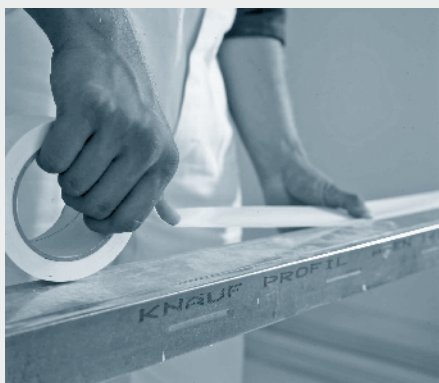
1. Samolepilni ločilni trak Knauf Trenn-Fix pritisnemo na stenski C- oz. stenski U-profil.

Pri pleskarskih delih, ki sledijo, moramo prevzeti ločilno fugo na delu stika.